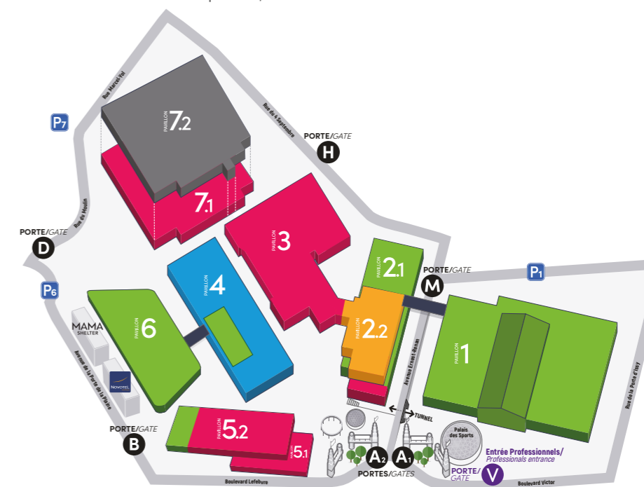
Plan arrêté au 15/12/2022, susceptible de modifications / Plan as at 2022/12/15, subject to modifications.