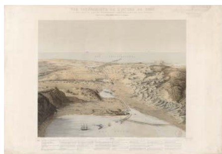
Vue panoramique de l'Isthme de Suez. Carte. 1855 Linant de Bellefonds, Louis Maurice Adolphe BnF, dép. des Cartes et Plans