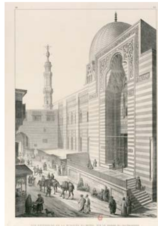
Emile Prisse d'Avennes, Vue extérieure de la Mosquée El-Moyed sur le Bazar El Soukkarieh. Le Caire BnF, dép. des Manuscrits