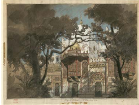
Les mille et une nuits : esquisse de décor. Philippe Chaperon. 1881 BnF, Bibliothèque-musée de l'Opéra