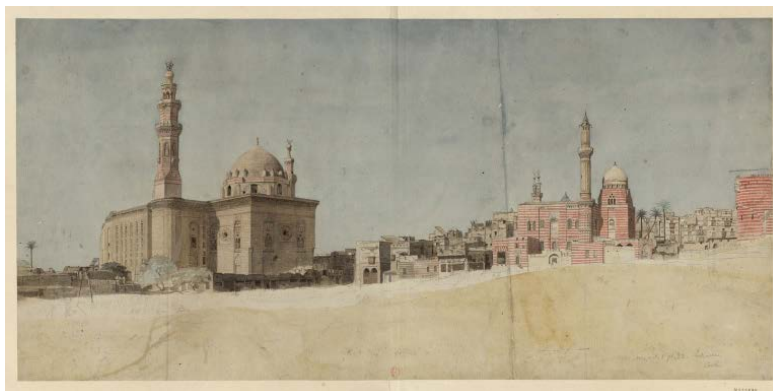
Le Caire, vue de la Mosquée du sultan Hassan. Dessin par Nicolas-Jacques Conté (1755-1805).