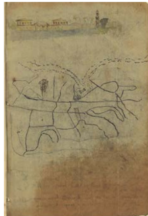
Gérard de Nerval. Carnet de voyage en Orient. BnF, dép. des Manuscrits