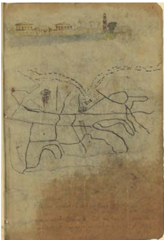
Gérard de Nerval. Carnet de voyage en Orient.