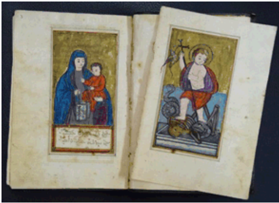
Le Bet Gazo ou recueil de livres liturgiques syriaques datant de 1691, conservé au monastère de Charfet du patriarcat syriaque catholique au Liban

Une attention particulière est portée à la préservation de patrimoines menacés. Deux recueils liturgiques syriaques des XI e et XVII e siècles, conservés au monastère de Charfet (Liban), et deux évangélistes des XIV e et XVI e siècles, appartenant au couvent Salvatorien Melkite de Jounieh (Liban), ont ainsi été restaurés avant d'être numérisés et mis en ligne sur Bibliothèques d'Orient .