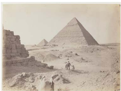
Pyramides de Gizeh, 1873-1895.

Bibliothèques d'Orient couvre la période 1798-1945 et s'étend principalement aux pays de la rive orientale de la mer Méditerranée.