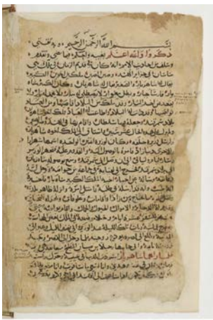
Les Mille et une Nuits, manuscrit, vers 1300 BnF, dép. des Manuscrits