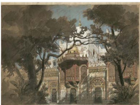
Les mille et une nuits : esquisse de décor. Philippe Chaperon. 1881 BnF, Bibliothèque-musée de l'Opéra

S'appuyant sur les fonctionnalités de Gallica, la bibliothèque numérique de la BnF, Bibliothèques d'Orient réunit des documents remarquables peu connus du public car dispersés entre différents pays et de multiples institutions. Ses contenus ont été définis par un conseil scientifique 1 . L'accès à l'ensemble des pièces est proposé à travers 7 rubriques : Carrefours, Communautés, Religions, Savoirs, Politiques, Imaginaires et Personnalités . Des textes de contextualisation rédigés par des scientifiques de haut niveau et disponibles en trois langues (français - arabe - anglais) permettent la mise en perspective des documents.