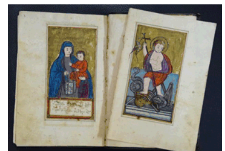
Le Bet Gazo ou recueil de livres liturgiques syriaques datant de 1691, conservé au monastère de Charfet du patriarcat syriaque catholique au Liban