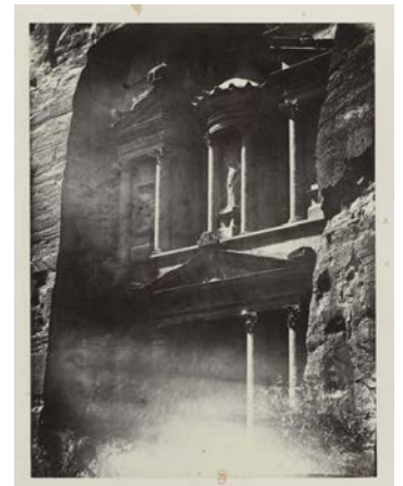
Voyage en Égypte, au Sinaï, en Jordanie et en Palestine. Petra. Albert Goupil. 1868. Photographie sur papier albuminé d'après des négatifs sur verre au collodion BnF, dép. des Estampes et de la photographie