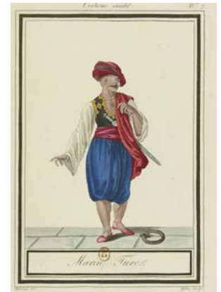
Costumes orientaux inédits, dessinés d'après nature. Marin turc. 1813. Georges-Jacques Gatine. BnF, dép. des Manuscrits