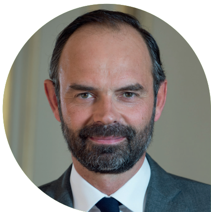
Edouard PHILIPPE Premier ministre