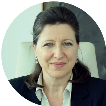
Agnès BUZYN Ministre des Solidarités et de la Santé