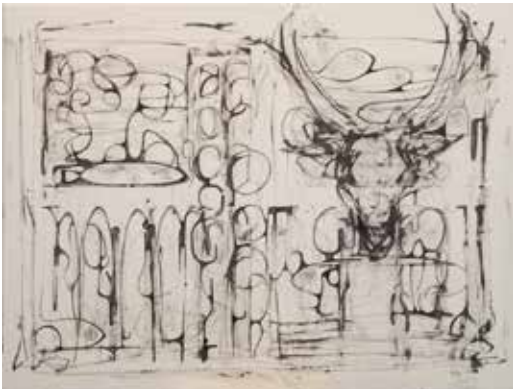
Pluto Fish , encre sur toile, Paris, 2017