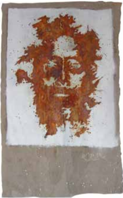
Humanité , technique mixte (rouille de métal, oxyde sur toile), Paris, 2017