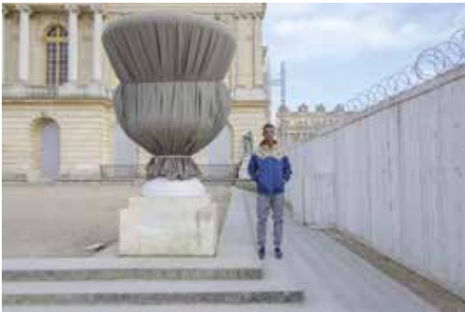
Réfugiés à découvert , photographies sur bâche, Versailles, 2017