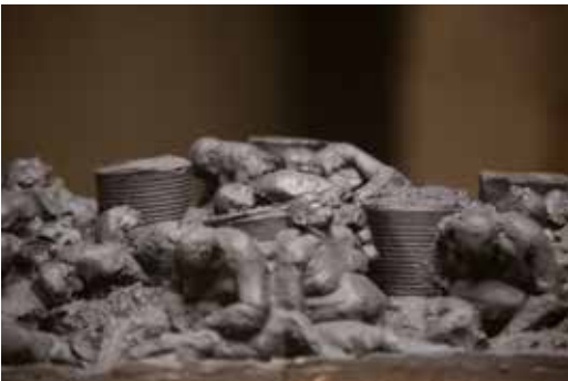
Ils dispersent dans le silence, bronze, Paris, 2018