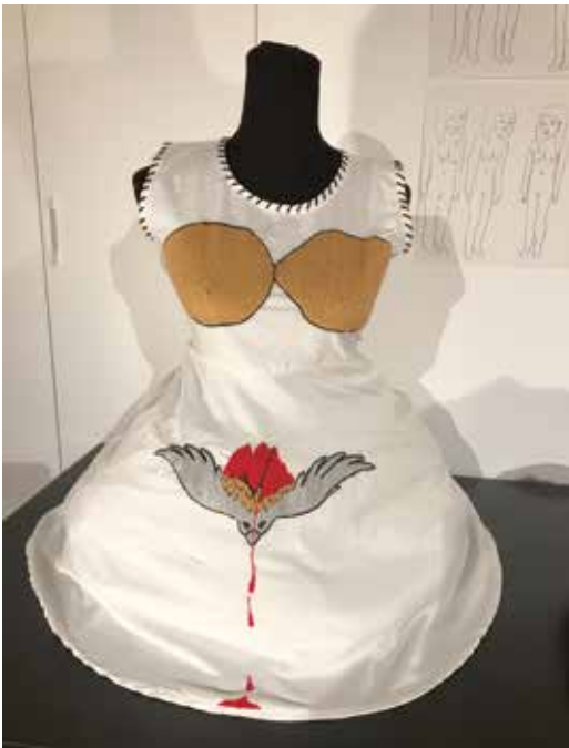
Empty spaces & desires to fly , tissus, broderie, métal, Paris, 2018