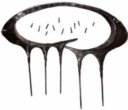
Recherche de liberté, métal soudé, Paris, 2017

Né en 1979 à Zabol en Iran, formé au dessin, à l'artisanat et à la peinture, Mehdi Yarmohammadi enseigne la peinture et la sculpture et participe à des expositions en Iran, au Danemark et en France, où il est forcé de rester depuis 2016 en raison des menaces qui pèsent sur lui en Iran. En mai 2017, il est accueilli pour un an avec son épouse, Hura Mirshekari, artiste peintre, à la Cité internationale des arts dans le cadre du programme du Ministère de la culture de résidence et d'accompagnement d'artistes réfugiés des zones de conflit.