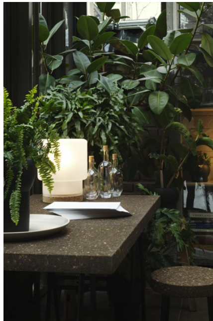
Sinnerlig Collection for IKEA

Avec la collection Sinnerlig, elle propose une gamme accessible de lampes, d'accessoires et de meubles qui traduisent son affection pour la poésie des matériaux naturels et des lignes douces.