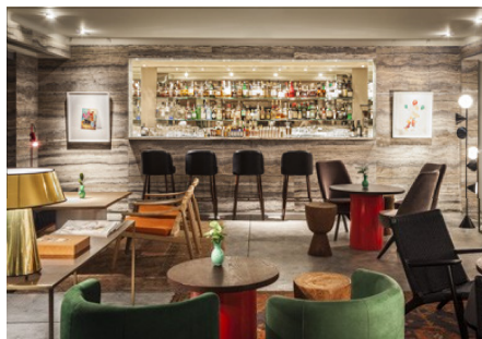
Club Duddell's HK 2013

Et en 2014, elle invente pour la VitraHaus le scénario d'habitation d'un couple finno-allemand qui permet la mise en scène des collections d'Artek et de Vitra.