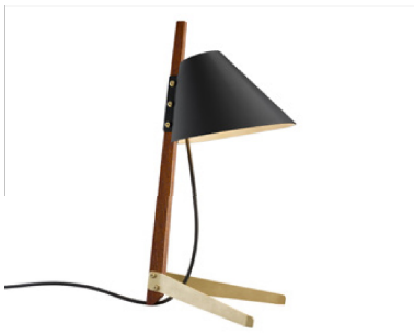
Billy T Lamp, Studioise edition for Kalmar