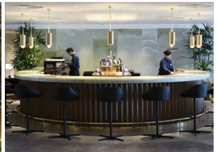
Cathay Pacific First Class Lounge, Hong Kong