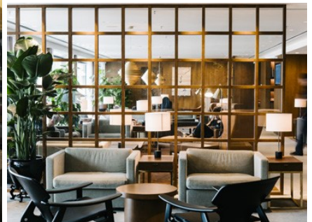
Salon Cathay Pacific First Class HK 2015