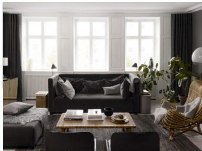
Ilse Sofa