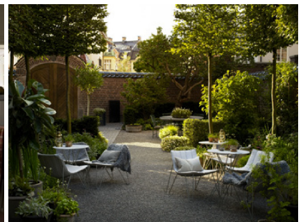
Ett Hem