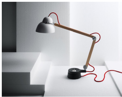
Wastberg W084 Lamp by Studioise