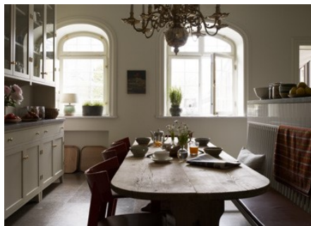
Ett Hem