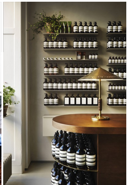
Aesop, Copenhagen