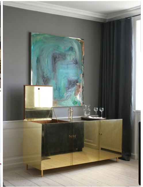
Studioise Brass Cabinet