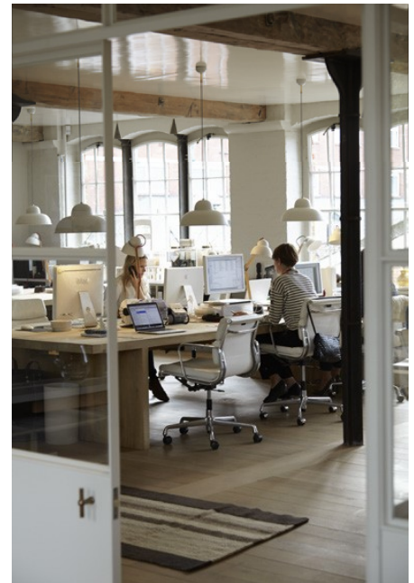
Studioilse Neckinger Mills

Historienne de formation, longtemps rédactrice en chef du magazine ELLE Décoration UK qu'elle a lancé, Ilse Crawford développe depuis la création de son agence Studioilse en 2001 une œuvre de conteuse. L'être humain occupe la première place de son propos.