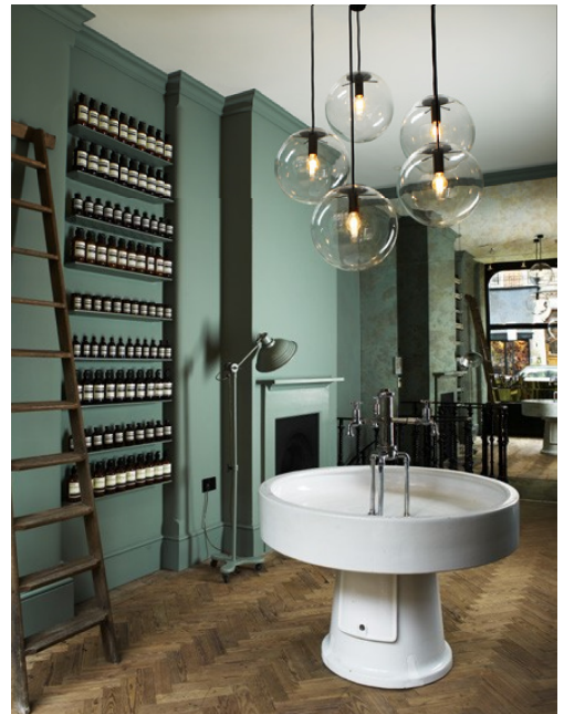
Aesop 2008

En 2008, pour la première boutique d'Aesop à Londres, sa réalisation privilégie le registre de l'intime en mettant en relief le cadre historique de l'architecture par des touches contemporaines savamment dosées.