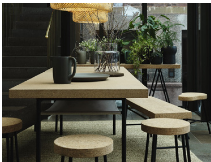
Sinnerlig Collection for IKEA