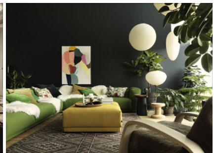
VitraHaus Loft © Felix Odell