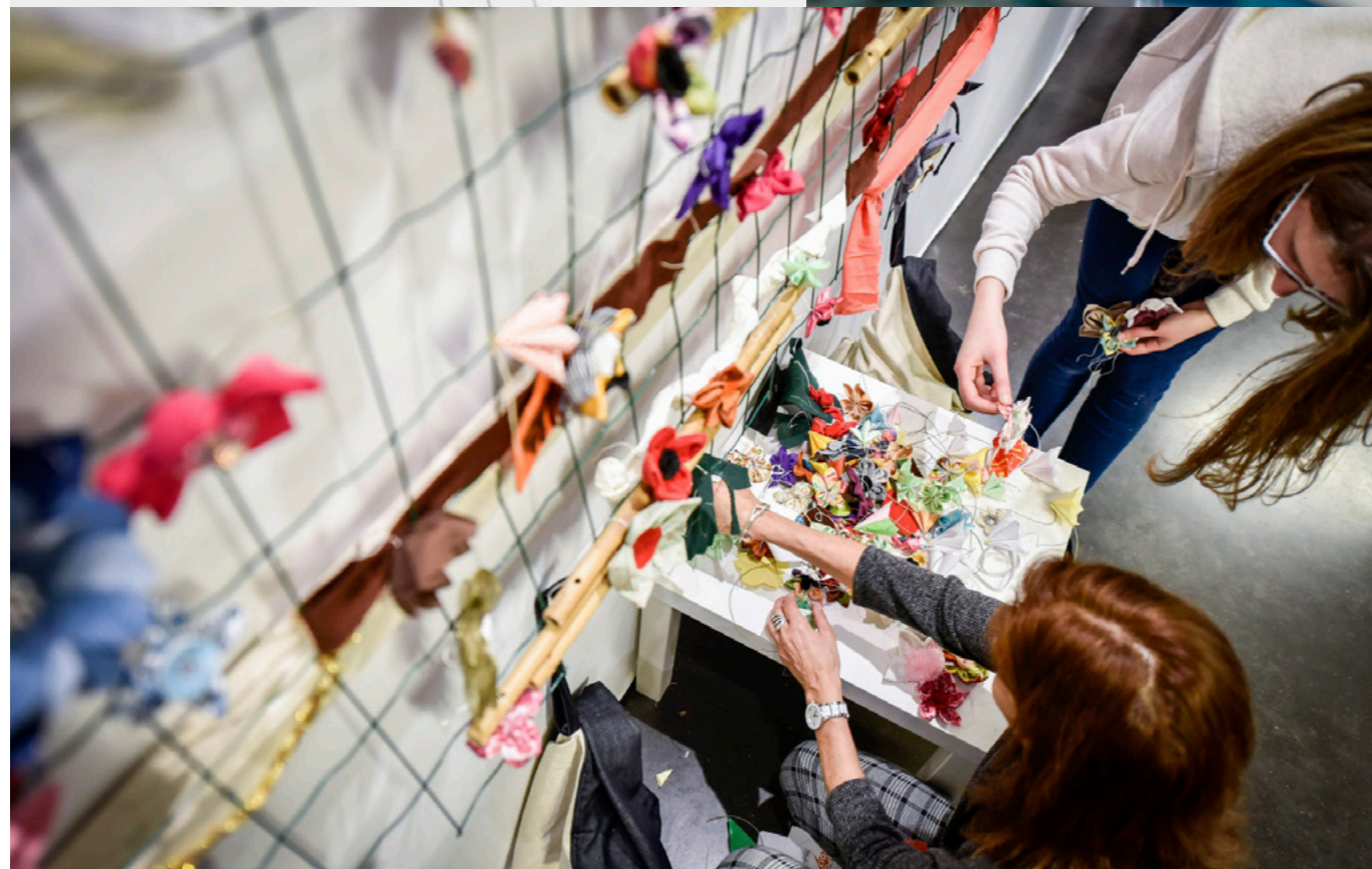
LYCÉE TOULOUSE LAUTREC © ANAKA