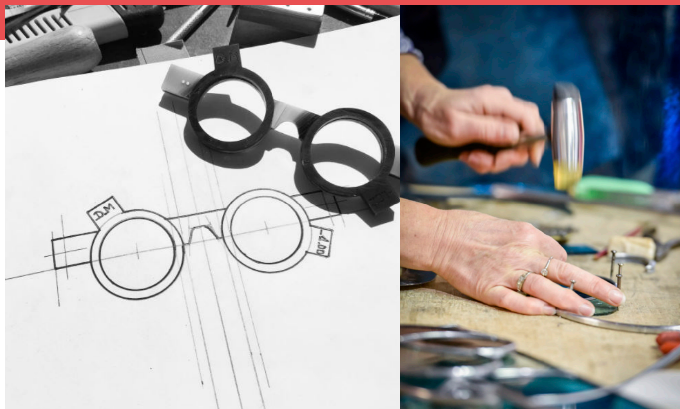
DAMIEN MIGLIETTA © DR