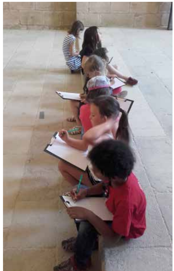
Des mots et des sons à l'abbaye de Noirlac © Abbaye de Noirlac (Centre-Val de Loire)