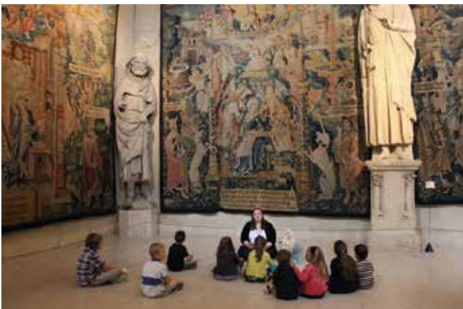
Au fil du Palais du Tau (Grand Est)