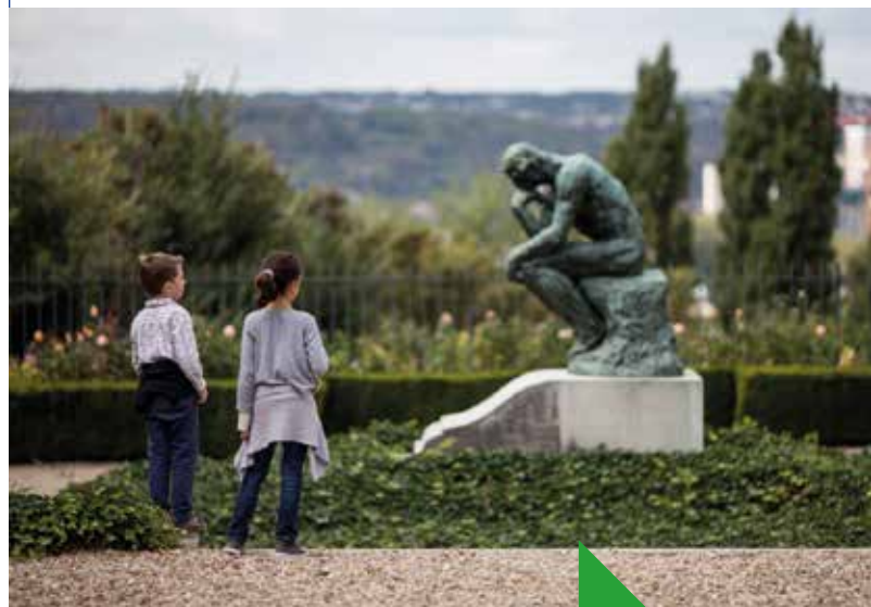
Découverte du musée Rodin de Meudon © Musée Rodin, A. Berg (Ile-de-France)