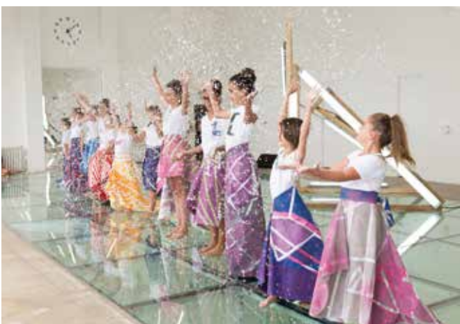
Villa Noailles, Hyères 2016 (Provence-Alpes Côte d'Azur)