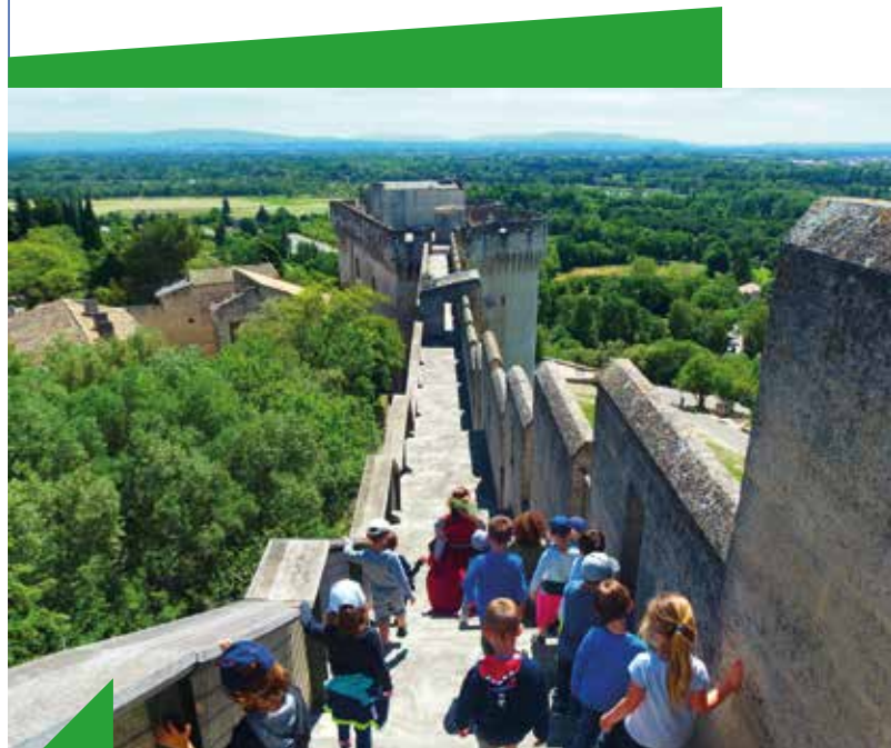
S'approprier le patrimoine médiéval par l'art et le jeu

Visite guidée et interprétation des œuvres de Toulouse Lautrec. Création théâtralisée au sujet de plusieurs tableaux de Toulouse Lautrec. Texte écrits par des jeunes des ateliers théâtre des MJC du Tarn.