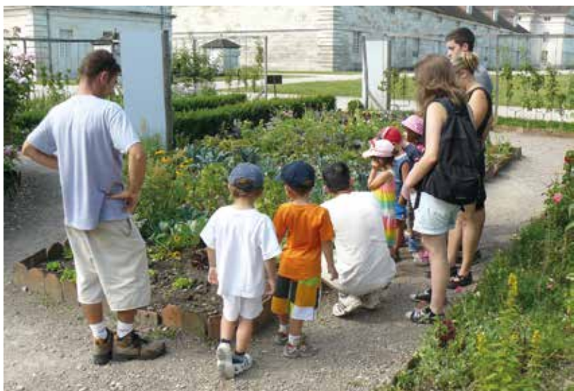
Découverte de la biodiversité