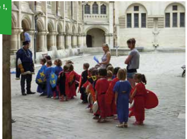
Château de Pierrefonds en mode chevalier