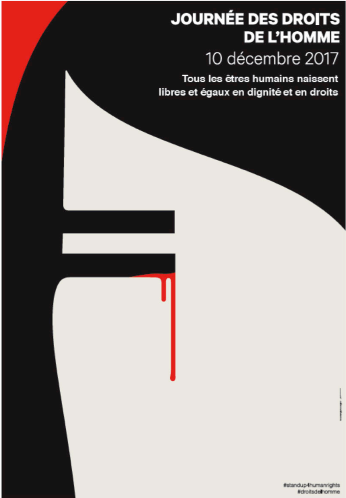
Affiche lauréate, « Agir » de Noma Bar