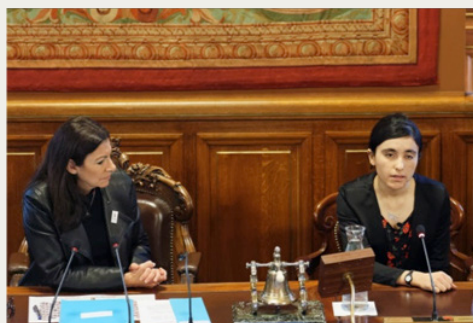
Témoignage de Lamyia Aji Bachar devant le Conseil de Paris

● Luttant contre les violences faites aux femmes : le 28 mars 2017, la Maire de Paris a accueilli au Conseil de Paris Lamyia Aji Bachar, lauréate du prix Sakharov 2016. Cette jeune femme yézidie de 18 ans est devenue, avec Nadia Mourad, autre lauréate du prix, la porte-parole des femmes victimes des violences sexuelles de Daech. Elle est venue témoigner du combat qu'elle mène pour faire reconnaître ce crime organisé contre les femmes et soutenir les nombreuses victimes. On estime que 5 270 femmes ont été enlevées en Irak, dont 3 800 seraient encore prisonnières de Daech. Le soutien de Paris à son combat s'est ensuite prolongé par une aide de 50 000€ en septembre 2017 à l'ONG Elisecare qui intervient directement auprès des femmes et enfants victimes de Daech en Irak. Le « bus des femmes et des enfants » d'Elisecare est animé par une équipe pluridisciplinaire assurant une prise en charge médicale et psychosociale des victimes.