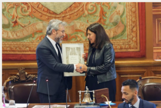
Remise de la Citoyenneté d'honneur à Can Dündar

Paris se tient aux côtés des journalistes turcs inquiétés quotidiennement dans leur pays : depuis l'instauration de l'état d'urgence en juillet 2016, une spirale de répression sans précédent frappe les journalistes et médias turcs. Plus de 140 médias ont été fermés, plus de 700 cartes de presse annulées et plus de 100 journalistes emprisonnés. Le 8 novembre 2016, la Maire de Paris a ainsi remis la Citoyenneté d'Honneur à Can Dündar, ancien rédacteur en chef du journal laïque et progressiste Cumhuriyet (La République) et condamné à cinq ans de prison pour avoir publié un article apportant la preuve de la livraison d'armes par les services de renseignement turcs à des rebelles islamistes syriens. Can Dündar est une figure du combat pour la liberté de la presse en Turquie. La Ville de Paris a apporté également son soutien à RSF pour sensibiliser l'opinion publique et les médias français sur la situation extrêmement grave dans laquelle se trouvent les journalistes en Turquie. En mai 2017, durant tout un week-end, des portraits de dix d'entre eux ont été réalisés au pochoir par l'artiste C215 sur du mobilier urbain dans plusieurs arrondissements de la capitale.