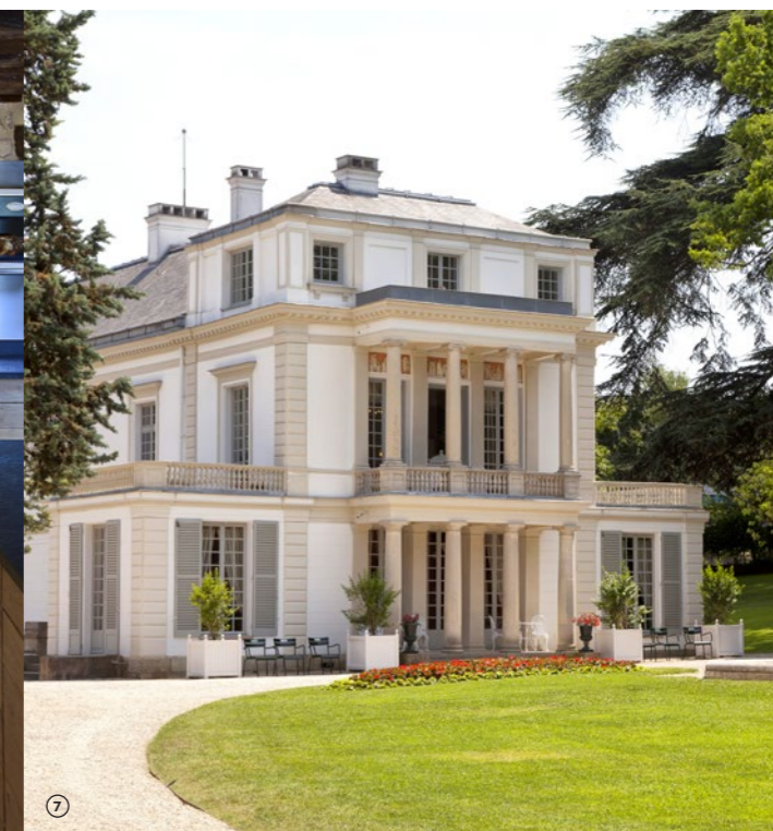
RESTAURATION PROPRIÉTÉ CALLEBOTTE

Fondée en 1952 et installée aujourd'hui dans le département de la Vienne, en Nouvelle-Aquitaine, la Maison Carcaillon est une entreprise familiale spécialisée dans la vente et l'installation de fourneaux d'exception. Elle conçoit et réalise aussi des aménagements de cuisines sur-mesure pour des particuliers, hôtels, chambres d'hôtes... Elle fournit dans ce sens des conseils en choix de fourneaux et d'équipements ménagers et propose un large choix de produits de cuisine de luxe. Son bureau d'étude conçoit le projet, réalise les plans techniques et met en œuvre la création envisagée. Il garantit enfin le suivi d'installation dans le cadre d'un plan Qualité.