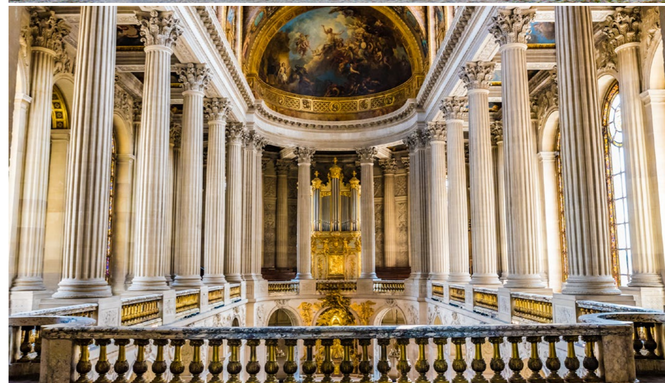
CHATELLE CHATEAU DE VERSAILLES