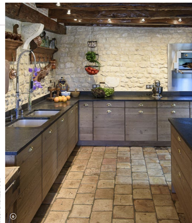
MAISON CARCAILLON

Installée depuis 1946 dans le marais, labellisée entreprise du patrimoine vivant, la maison ARTE – «art et restauration par traitement électrolytique» – est spécialisée dans la restauration de bronzes d'antiquité et de pièces d'orfèvrerie ainsi que dans la fabrication, d'après modèle, destinée aux œuvres d'art contemporaines. Entre tradition et innovation, elle rayonne au-delà de ses frontières grâce aux compétences et aux savoir-faire exceptionnels de ses maîtres bronziers et de ses compagnons qui maîtrisent l'art du bruni main et de la double patine comme celui de la dorure à l'ancienne, du Vermeil ou de l'Argent vieilli pour l'Orfèvrerie.