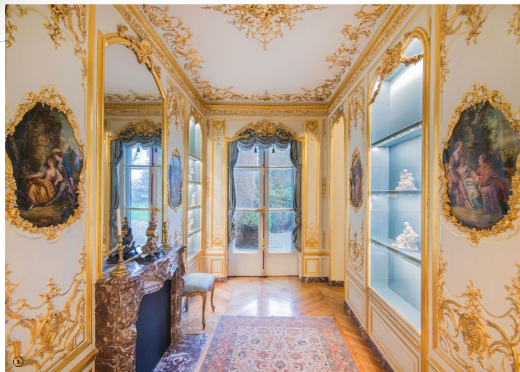
AMBASSADE DE SUISSE À PARIS