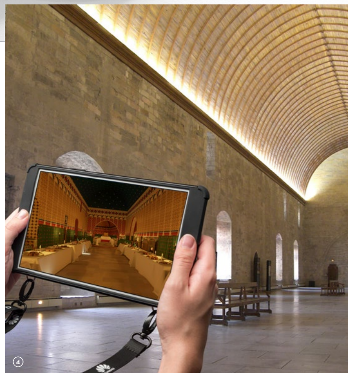
MASTERSUISSEL GRANDTHERMOR