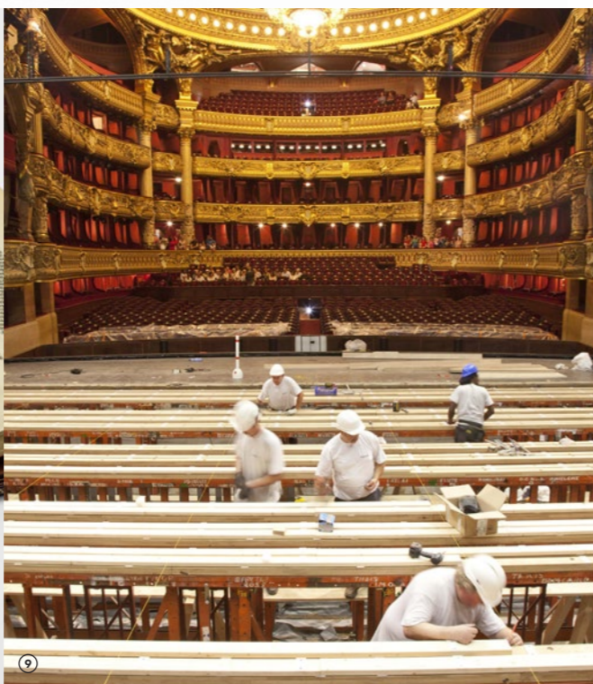
OPÉRA GARNIER

Basée à Barcelone, M. Moleiro est spécialisé dans la reproduction de codex et de cartes, oeuvres réalisées entre les VIII e et XVI e siècles sous la forme, en général, d'enluminures. Sélectionnés selon leur singularité, leurs illustrations et leur importance historique, ils reproduisent avec une fidélité et un savoir-faire d'une grande précision les méthodes originales. Ils sont reliés en peau tannée et édités sur un papier spécial fabriqué à la main. M. Moleiro a réalisé des «quasi-originaux» de manuscrits issus des collections des plus grandes bibliothèques, musées et archives du monde entier, parmi lesquels le Met de New York, le Musée Archéologique national de Madrid, la Bibliothèque Nationale de Russie, la bibliothèque Casanatense de Rome, la Bibliothèque nationale de France, la British Library, le Musée Calouste Gulbenkian de Lisbonne, et bien d'autres.