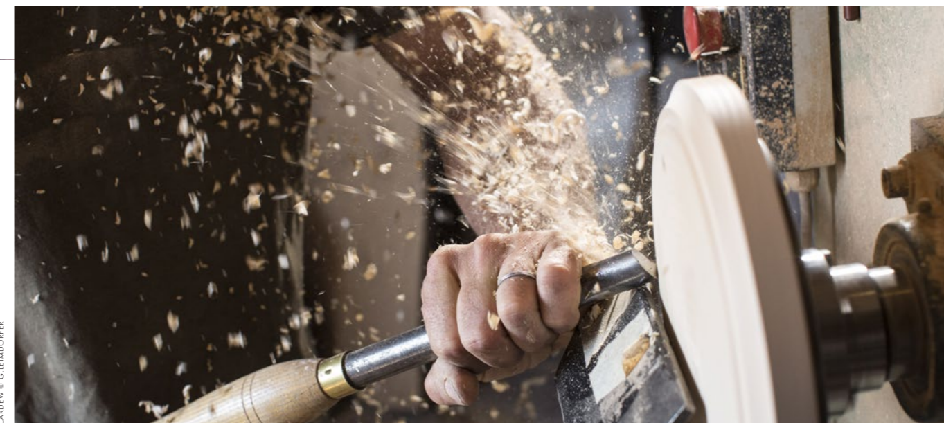
CARDEW © G. LEINDORFER

Pour accompagner ce développement, le salon s'entoure une nouvelle fois d'institutions, collectifs ou associations engagés, focus sur 4 acteurs ayant à cœur de soutenir et valoriser les richesses de notre patrimoine européen.