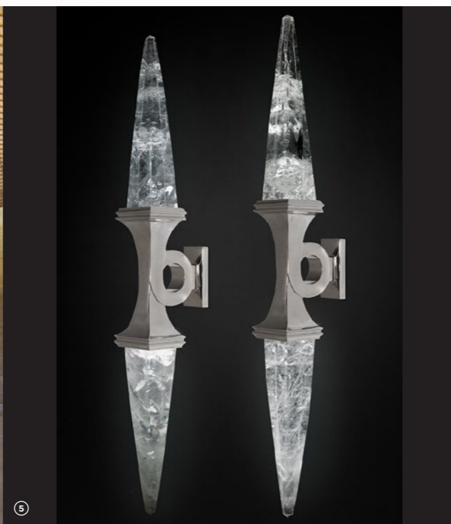
APPLIQUES EN BRONZE PALADIÉ

Jeune entreprise de 5 ans, Histoverly valorise le patrimoine culturel grâce à des solutions digitales innovantes, notamment à travers le principe de réalité augmentée : la start-up a ainsi mis au point un service de tablette numérique, l'HistoPad, qui plonge le visiteur dans une expérience immersive sur le principe de la reconstitution en trois dimensions. Chaque projet est par ailleurs développé dans une logique universelle et d'accessibilité à tous les publics et dans le plus rigoureux respect des données scientifiques en histoire de l'art. L'HistoPad fournit également des données statistiques sur les comportements des publics pour mieux accueillir les visiteurs. Histoverly compte déjà parmi ses nombreuses références des institutions telles que le Palais des Papes, le Château de Chambord, la Conciergerie ou encore le chateau royal de Blois.