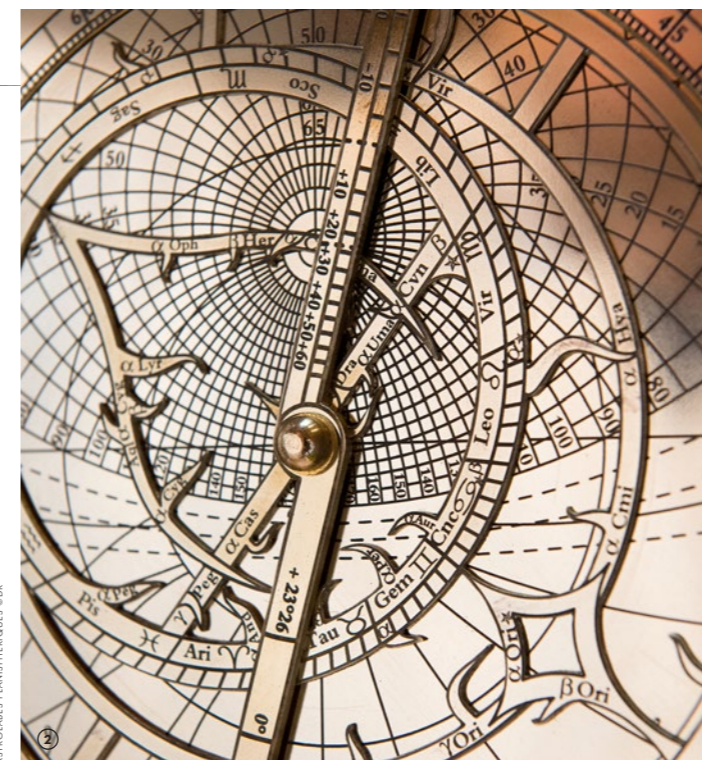
ASTROLABES PLANISPHERIQUES