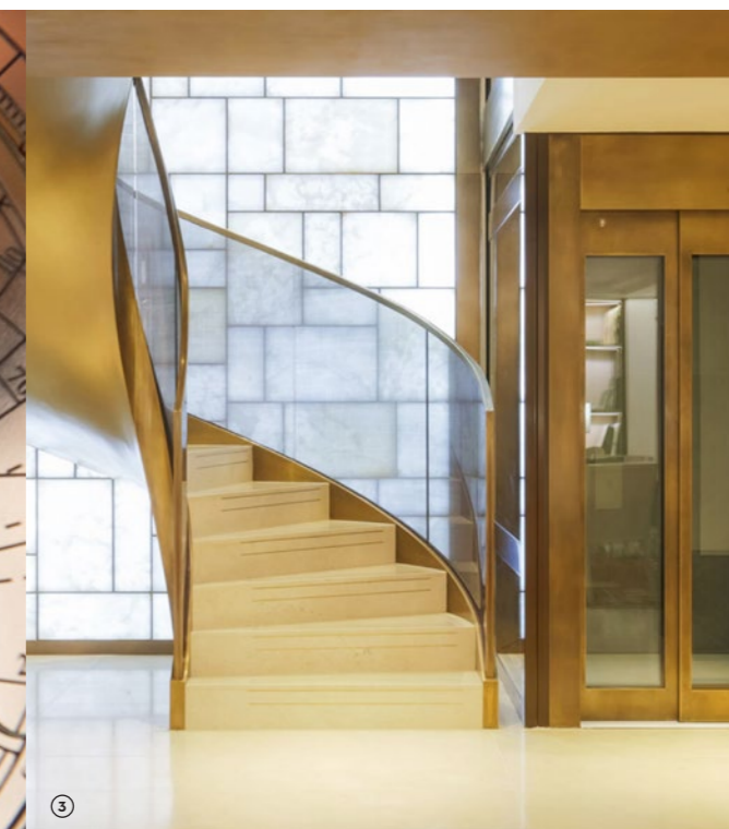
MUR EN ALBÂTRE RÉTRO-ÉCLAIRÉ RÉALISÉ POUR LA BOUTIQUE POTEK PHILIPPE À LONDRES