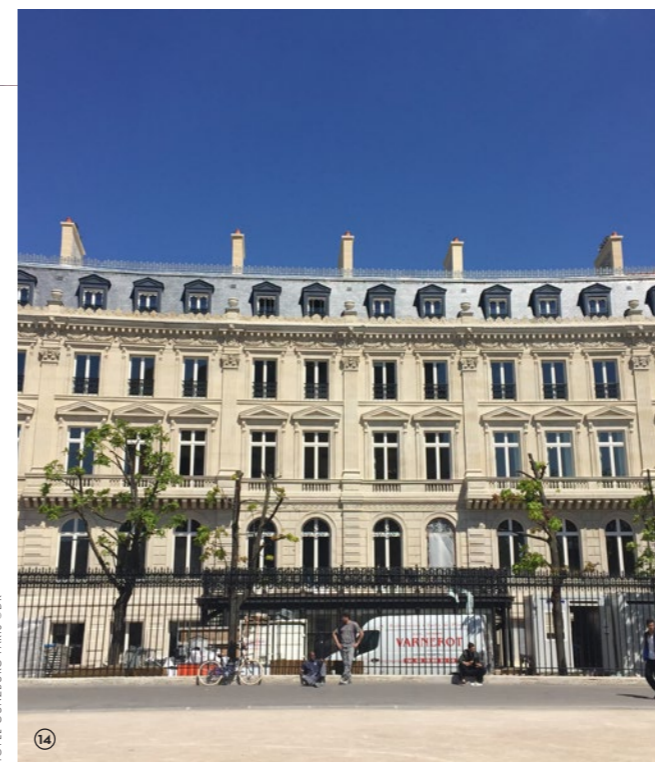
HÔTEL GUNZBURG PARIS

Créée en 1978 et installée à Delft, aux Pays-Bas, l'entreprise Van Ruysdael développe une réflexion précurseur sur l'isolation durable et conçoit des solutions d'isolation saines et innovantes, respectueuses du bâti et de l'environnement. En 2002, l'entreprise brevète un verre unique qui se distingue par sa minceur, sa clarté, sa résistance et sa qualité et sa durée de vie, permettant un meilleur rendement, une augmentation d'économie d'énergie et une meilleure isolation acoustique. L'entreprise opère sur toutes les architectures classiques et celles des années 20, 30, 50 et 60. Elle compte parmi ses réalisations de nombreux monuments français, comme le Musée Galliera, la Sorbonne, le Palais Bourbon, et bien d'autres. Leurs solutions innovantes intéressent également le constructeur moderne soucieux, selon ses mots, « de bâtir dans le respect de l'homme et son environnement ».