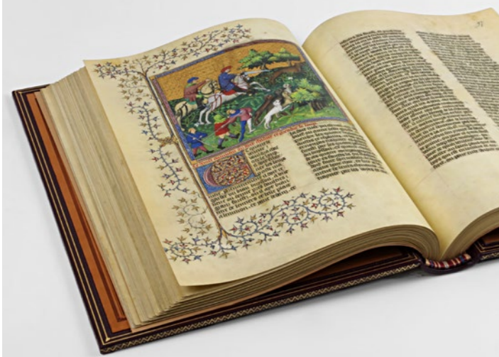
MOLEIRO - LIVRE DE LA CHASSE DE GASTON FÉBUS