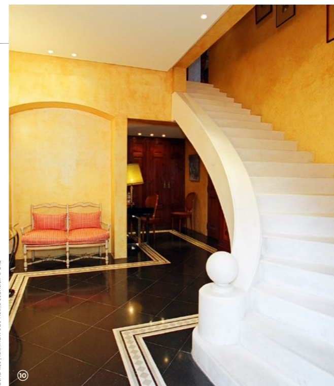
SOLAG RESTAURATION SOL PIERRE ESCALIER

Renofors est une entreprise spécialisée dans les travaux de charpente et le sauvetage de constructions anciennes et modernes qui présentent des signes d'affaiblissement mécanique ou d'altération des matériaux. De la Cité radieuse de Marseille aux églises néogothiques en passant par les piliers aériens du métro parisien et le plancher de l'Opéra National de Paris, ses champs d'interventions sont larges grâce à un savoir-faire diversifié et des procédés propres développés par l'entreprise : réparation et rigidification d'éléments de grande portée, reconstitution de charpentes porteuses in situ, traitement des pathologies du bois, rigidification de travaux de pierre ou maçonnerie, renforts d'arcs de voûte, etc.